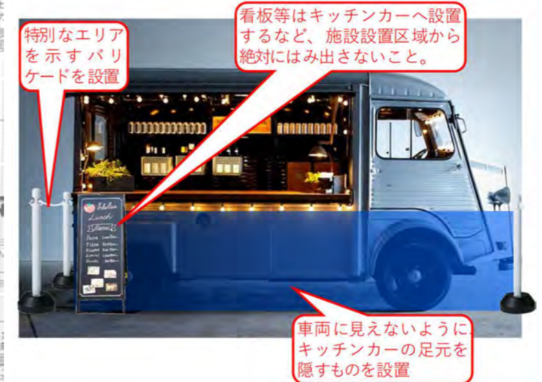
キッチンカー設置イメージ